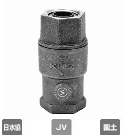
圧力損失表 (流体: 清水)

管接続: JIS B0203, 製作範囲: 15-50mm(1/2-2inch), 認証: 日本水道協会基本基準認証品 15-50mm(1/2-2inch), 規格: (株)日本バルブ工業会規格適合品 15-50mm(1/2-2inch), 国土交通省機械設備工事共通仕様書適合品 15-50mm(1/2-2inch), 弁箱 材料: CAC911, ふた 材料: CAC911, 弁体 材料: NBR, 製品記号: RFNW