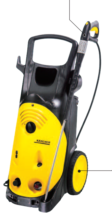
HD 13/15 S

圧力と水量を手で細かくコントロールできる特許取得の優れたトリガーガンです。更に握り易い形状で長時間の作業でも疲労を少なくします。