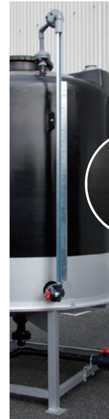
天板返し式 タンク最大容量値まで確 認ができる連通式です。