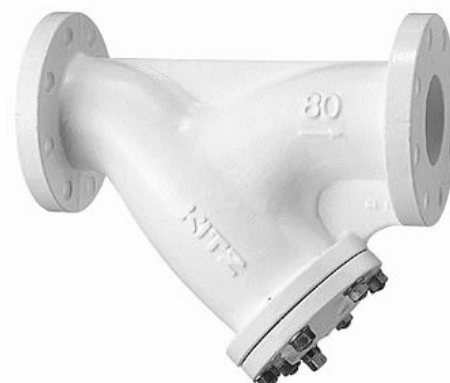
圧力損失表 (流体 : 清水)

認証 : 日本水道協会基本基準認証品 50-300mm(2-12inch), 製品記号 : 10FCYN