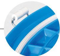
密閉度を高める 軟質塩ビパッキン