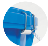
扱いやすい ベントローラ