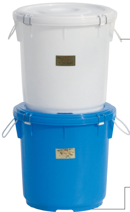
縦積みして収納できます