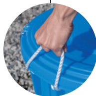
持ち運びに便利な ナイロン持ち手