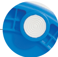
摩耗に強いナイロン インサート (75Lのみ)