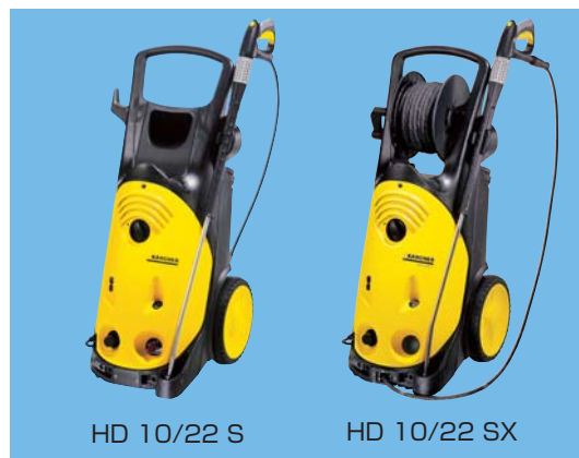
HD 10/22 S